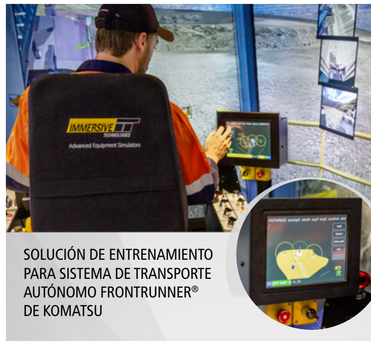
SOLUCIÓN DE ENTRENAMIENTO PARA SISTEMA DE TRANSPORTE AUTÓNOMO FRONTRUNNER® DE KOMATSU