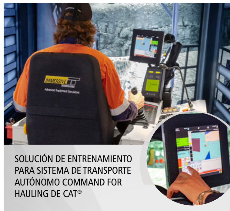
SOLUCIÓN DE ENTRENAMIENTO PARA SISTEMA DE TRANSPORTE AUTÓNOMO COMMAND FOR HAULING DE CAT®